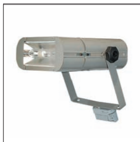
Reflector IVEN HQI 150W EUR 50.00 Cod 019.010.200.005