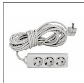
Prelungitor 230V, 10A, 5m EUR 18.00 Cod 019.010.279.000