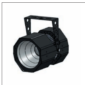
Reflector LED VIRGO 40W 4350 LM 4100 K EUR 55.00 Cod 019.010.200.045