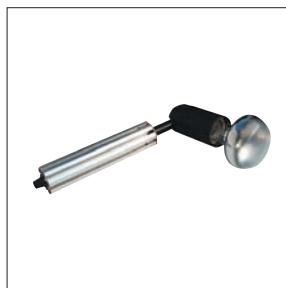
Lampa spot stut OCTANORM EUR 21.00 Cod 019.010.187.000