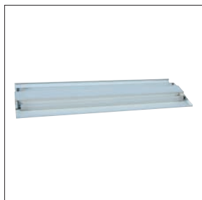
Corp fluorescent tip OCTANORM cu doua tuburi D-171 EUR 29.00 Cod 019.010.200.000