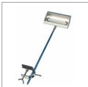
Reflector cu brat 300W EUR 50.00 Cod 019.010.200.010