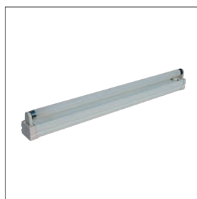
Corp fluorescent tip SS30 cu un tub D-170 - A EUR 27.00 Cod 019.010.190.001