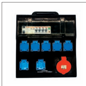
Panou Electric 380V/220V EUR 210.00 Cod 019.010.265.000