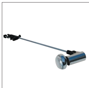
Lampa spot cu brat EUR 21.00 Cod 019.010.180.000