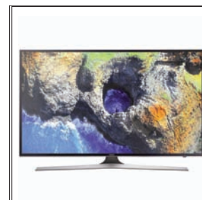
TV SAMSUNG UHD EUR 85.00/zi (diagonala ecran: 163 cm) Code 025 010 130 047