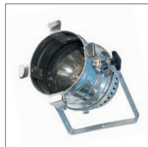
Reflector PAR64 500-1000W EUR 55.00 Cod 019.010.200.020