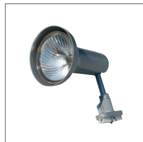
Spot halogen 100W SY STAR EUR 24.00 Cod 019.010.185.000