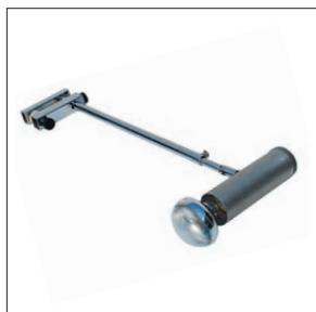
Lampa spot cu brat 100W EUR 21.00 Cod 019.010.181.000