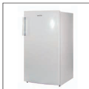
Frigider ARCTIC FB 155 EUR 36.00 Cod 025 010 020 198