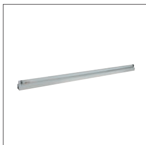
Lampa fluorescenta FIA cu instalatie electrica completa 1x40W EUR 24.00 Cod 019.010.110.000