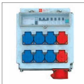
Panou Electric OCTANORM EUR 210.00 Cod 019.010.275.000