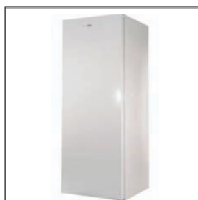
Frigider ARCTIC 255 I EUR 80.00 Cod 025 010 020 199