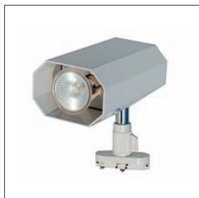
Spot halogen SY STAR 50W(A) EUR 24.00 Cod 019.010.186.000