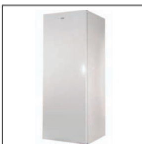
Frigider ARCTIC 255 I EUR 80.00 Cod 025 010 020 199