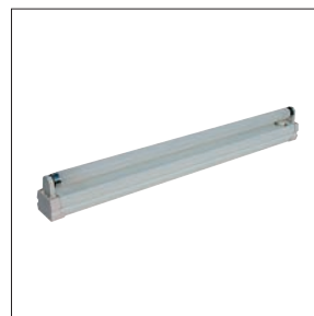
Corp fluorescent tip SS30 EUR 27.00 cu un tub D-170 -A Cod 019.010.190.001