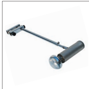
Lampa spot cu brat 100W EUR 21.00 Cod 019.010.181.000