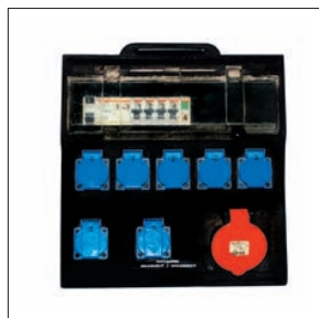
Panou Electric 380V/220V EUR 210.00 Cod 019.010.265.000