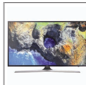
TV SAMSUNG UHD EUR 85.00/day (diagonal screen: 163 cm) Code 025 010 130 047