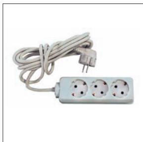
Prelungitor 230V, 10A, 3m EUR 18.00 Cod 019.010.277.000

Baby Boom Show 29 FEBRUARIE - 3 MARTIE 2024 ROMEXPO/B2