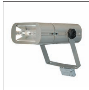
Reflector IVEN HQI 150W EUR 50.00 Cod 019.010.200.005