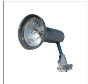
Spot halogen 100W EUR 24.00 SY STAR Cod 019.010.185.000