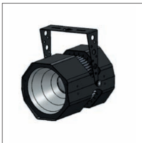
Reflector LED VIRGO 40W 4350 LM 4100 K EUR 55.00 Cod 019.010.200.045