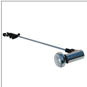
Lampa spot cu brat EUR 21.00 Cod 019.010.180.000