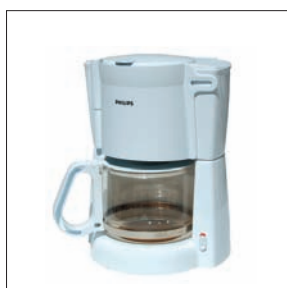
Filtru de cafea EUR 10.00 Cod 025.010.120.010