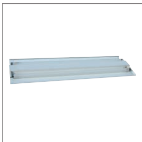
Corp fluorescent tip OCTANORM EUR 29.00 cu doua tuburi D-171 Cod 019.010.200.000