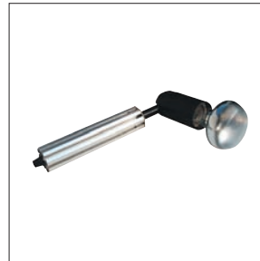
Lampa spot stut OCTANORM EUR 21.00 Cod 019.010.187.000