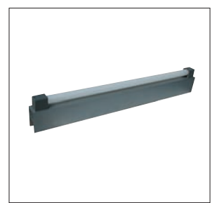
Corp fluorescent tip SS30 EUR 24.00 cu un tub D-170 Cod 019.010.190.000