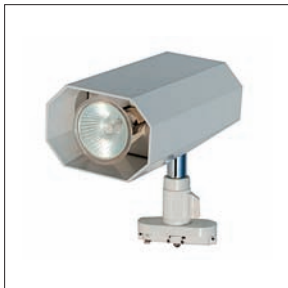
Spot halogen SY STAR 50W(A) EUR 24.00 Cod 019.010.186.000