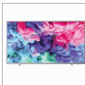
TV LED SMART 4K, UHD ultrasubtire EUR 55.00/zi (diagonala ecran: 126 cm) Cod 025 010 130 045