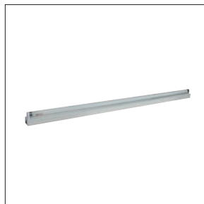
Lampa fluorescenta FIA EUR 24.00 cu instalatie electrica completa 1x40W Cod 019.010.110.000