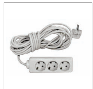
Prelungitor 230V, 10A, 5m EUR 18.00 Cod 019.010.279.000