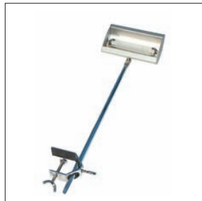
Reflector cu brat 300W EUR 50.00 Cod 019.010.200.010