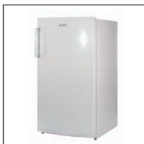
Frigider ARCTIC FB 155 EUR 36.00 Cod 025 010 020 198