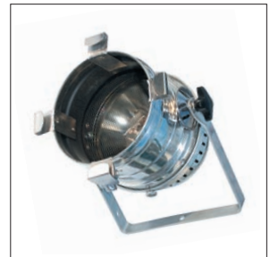
Reflector PAR64 500-1000W EUR 55.00 Cod 019.010.200.020